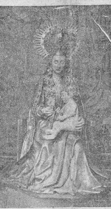
Venerada imagen de Santa Maria la Mayor, excelsa patrona de la Cabeza de Castilla, a quien los burgaleses elevarán sus fervorosas plegarias, en fervorosa rogativa, a su paso triunfal por las calles de la ciudad.