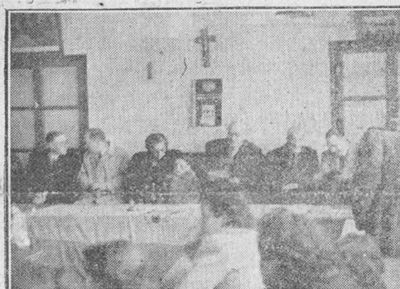
Los niños de la barriada que lleva su nombre, durante el acto de distribución de aguinaldos a 500 niños de la barriada que lleva su nombre.

Abajo, el matrimonio y la huertana a quienes nuestro Rvmo. Prelado sentó en su mesa con motivo de la Noche Buena última