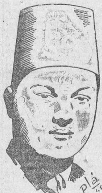
FARUK, REY DE EGIPTO

Madrid.—Las autoridades del aeropuerto de Barajas, han declarado este cerrado al tráfico aéreo. La intensa niebla de estos días hace imposible la utilización de Barajas y esta ha sido causa de lo dispuesto por los técnicos del aeropuerto,