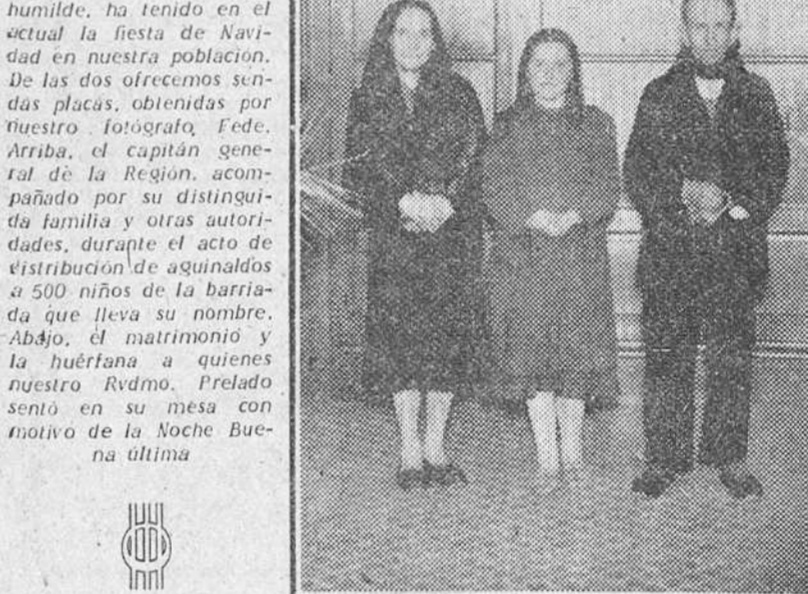
El matrimonio y la huertana a quienes nuestro Rvmo. Prelado sentó en su mesa con motivo de la Noche Buena última

Abajo, el matrimonio y la huertana a quienes nuestro Rvmo. Prelado sentó en su mesa con motivo de la Noche Buena última