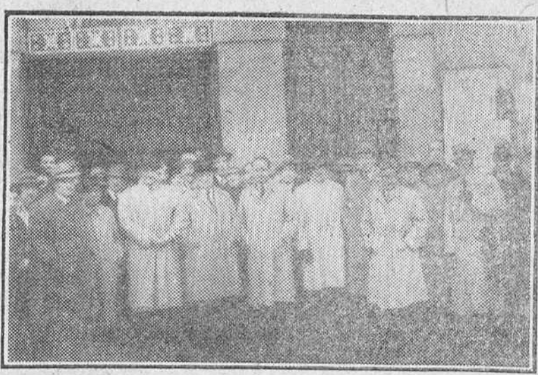
Los abogados del Colegio de Burgos, que ayer solem izaron brillantemente la festividad de su Patrona, la Inmaculada Concepción. Fotografados a la puerta de la iglesia de los Padres Carmelitas.