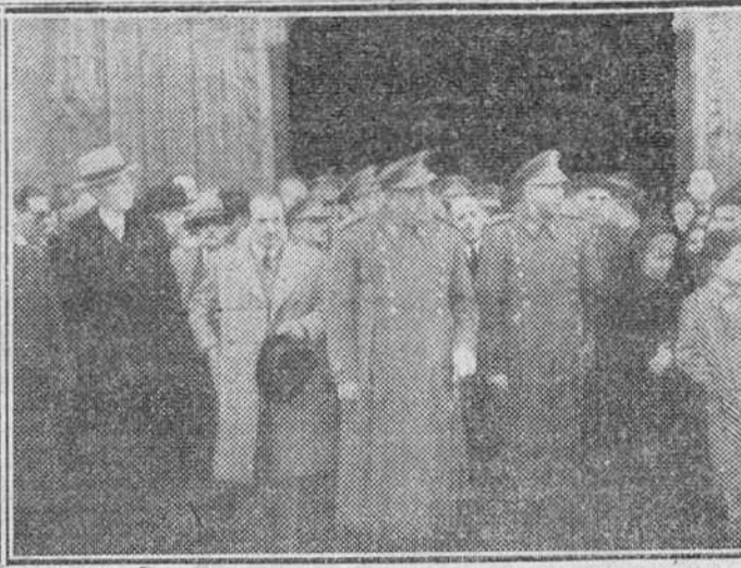
A la izquierda, una pequeña, besando el anillo pastoral de nuestro Rvdo. Prelado, a la salida de la solemne función religiosa que se celebró ayer en nuestro S. T. M. A la derecha, el capitán general de la Sexta Región y las autoridades burgalesas, presenciando el desfile de las fuerzas de Infantería, después de la misa celebrada en la iglesia de la Merced.