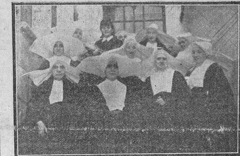
La Madre Superiora General de las Hijas de la Caridad, rodeada por varias superiores de Valladolid y Burgos, durante su visita a nuestra ciudad.