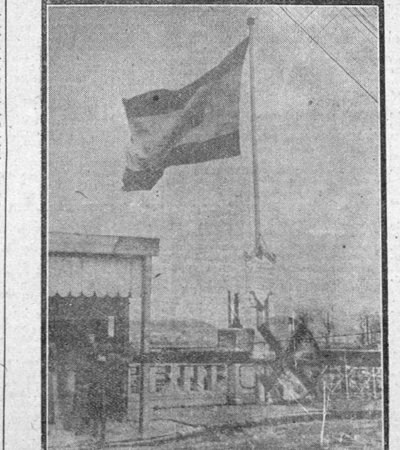
Una vista del puente internacional sobre el río Bidasoa, que separa España de Francia y que nuevamente, a partir de hoy, queda abierto al tráfico de viajeros. En primer término, la barrera del puesto fronterizo español echada. Al fondo, izada la Bandera española.