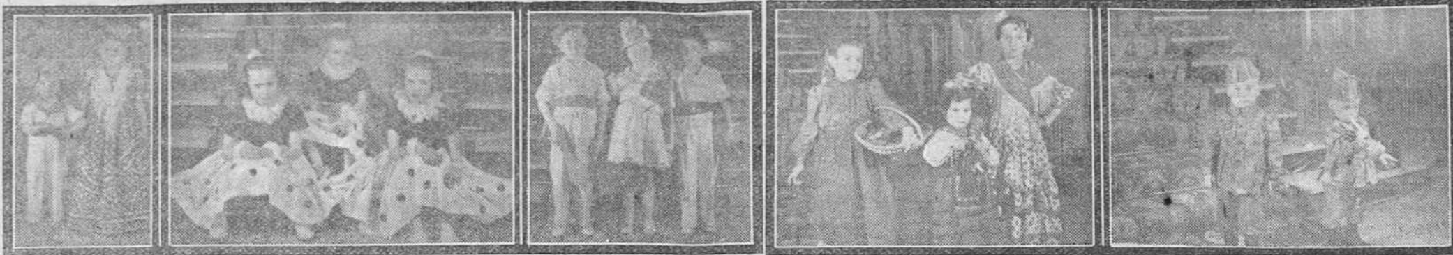
Otro grupo de pequeños concurrentes al baile infantil celebrado el pasado domingo con gran brillantez en la Residencia del "Dos de Mayo". En todas las "fotos" puede observarse la propiedad con que los niños acudieron "disfrazados" y a gracia y simpatía de sus ingenuos rostros frente al fotógrafo. -- (Fotos: FEDE)