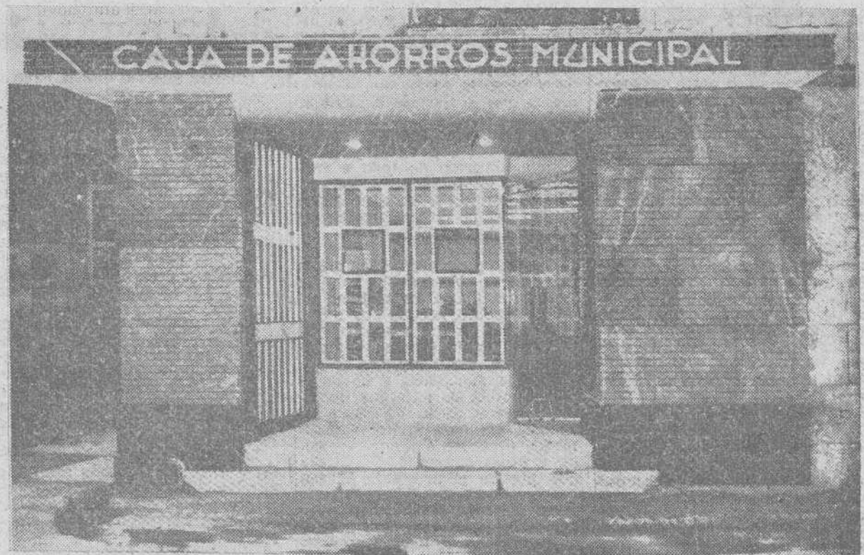
Aspecto exterior de la nueva Agencia Urbana que la Caja de Ahorros Municipal ha instalado en el barrio de Gamonal y que hoy entrará en servicio.