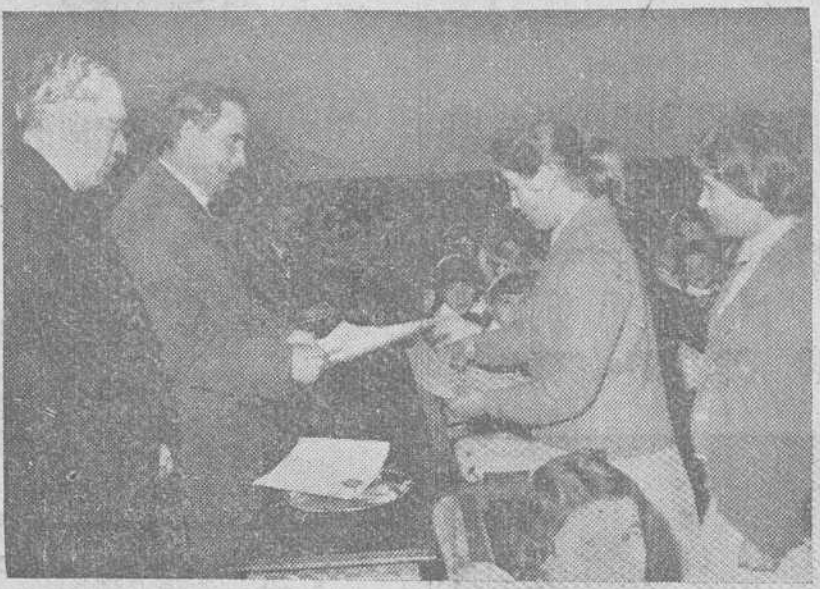
Un momento de la entrega de certificados de Estudios Primarios, a las alumnas de las Escuelas Profesionales Femeninas de la barriada "Juan Yagüe", acto celebrado en la tarde de ayer.