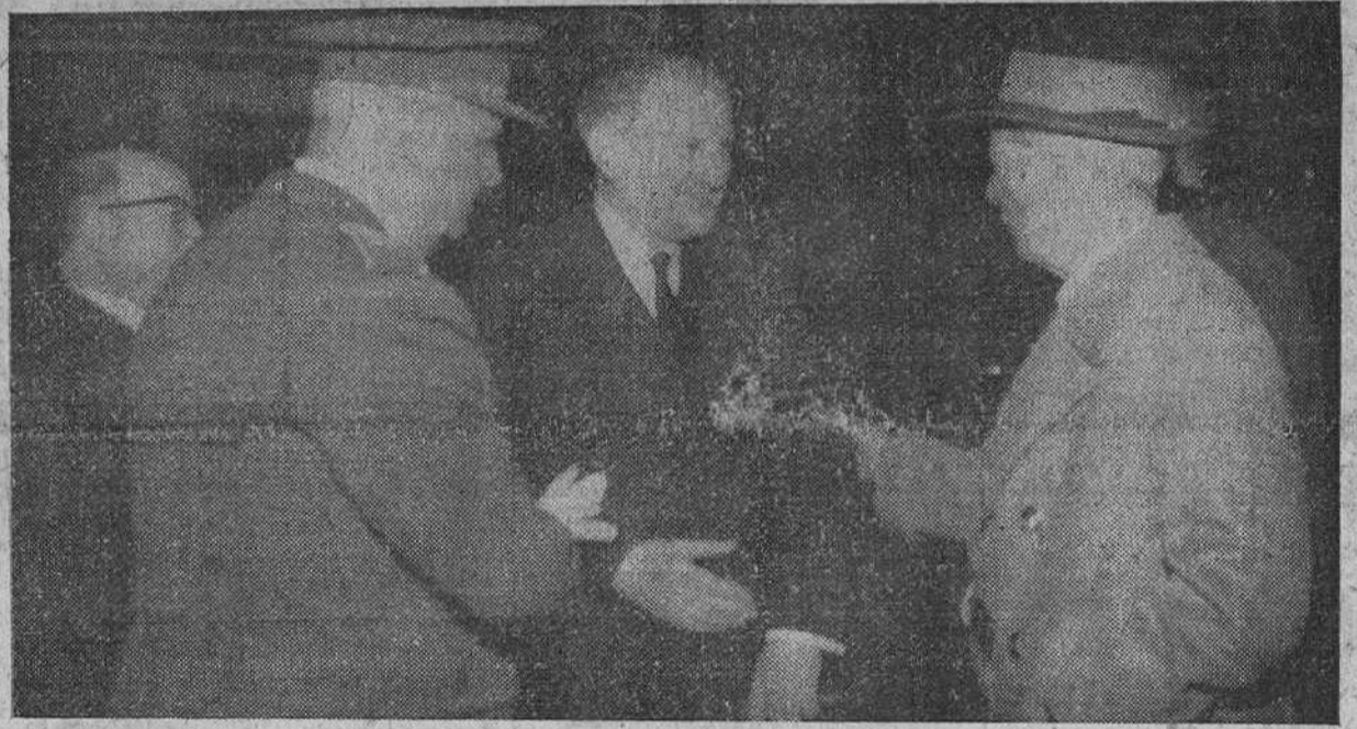
Madrid. — El Sr. Castiella, conversando con los ministros del Ejército y del Aire que acudieron a despedirle al aeropuerto de Barajas, con motivo de su viaje a Washington, invitado por el Gobierno norteamericano.