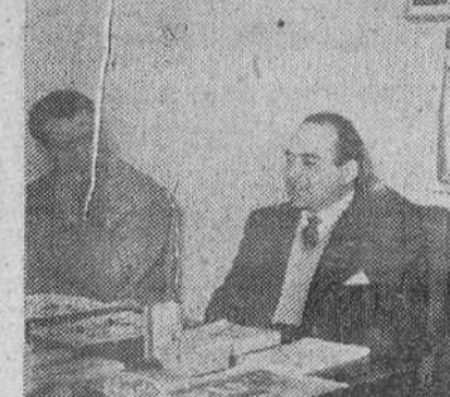
Los detallistas de Ultramarinos burgaleses en animada conversación con el director de la "SPAR" (segundo por la izquierda) al final de la importante reunión celebrada días pasados.