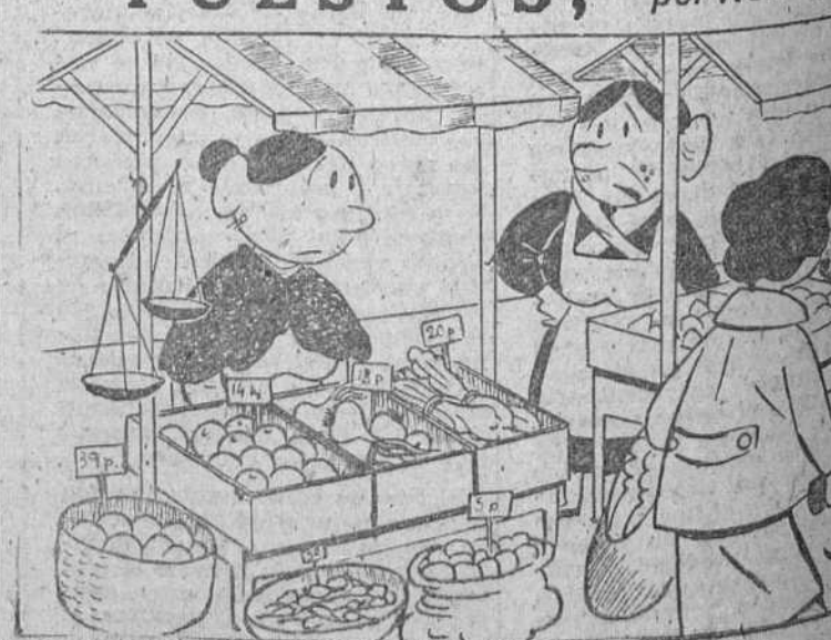
—Y tú ¿qué opinas de los supermercados?