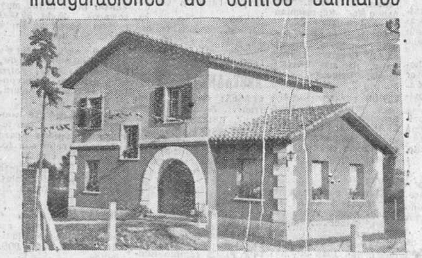
Perspectiva del magnífico centro primario de higiene rural, construido en Santa María Rivarredonda, uno de los tres edificios similares bendecidos e inaugurados ayer, con asistencia de las primeras autoridades provinciales, en dicha localidad y en las de Quintana de Valdivielso y Quintanavides.