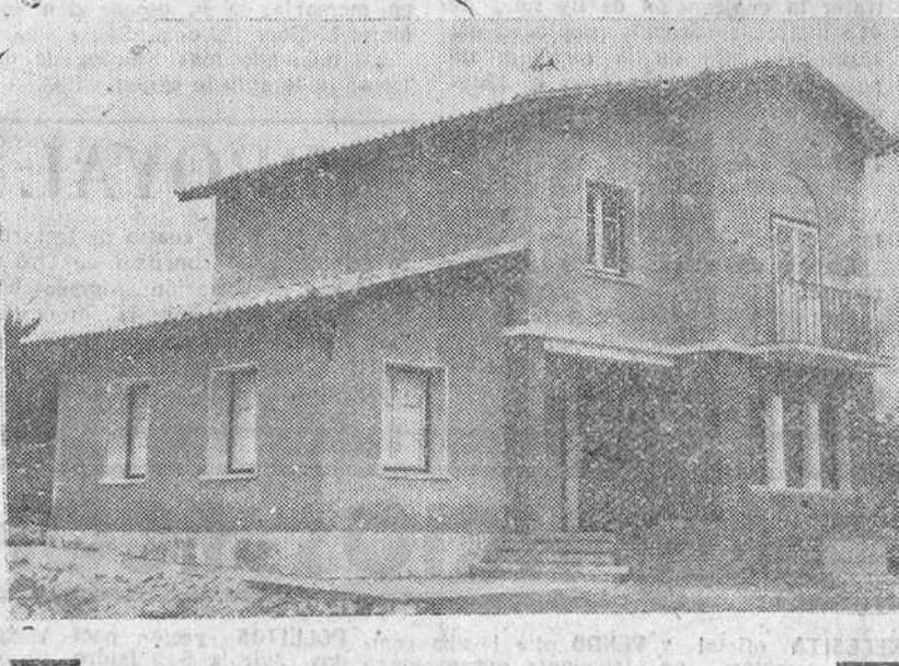
Perspectiva del magnífico centro rural de higiene, inaugurado ayer por el gobernador civil en el pueblo de Buniel.