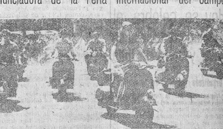
En la gran cabalgata anunciadora de la Feria Internacional del Campo figuró un lucido grupo de motoristas, sobre "Vespa", grupo que recoge el precedente grabado.