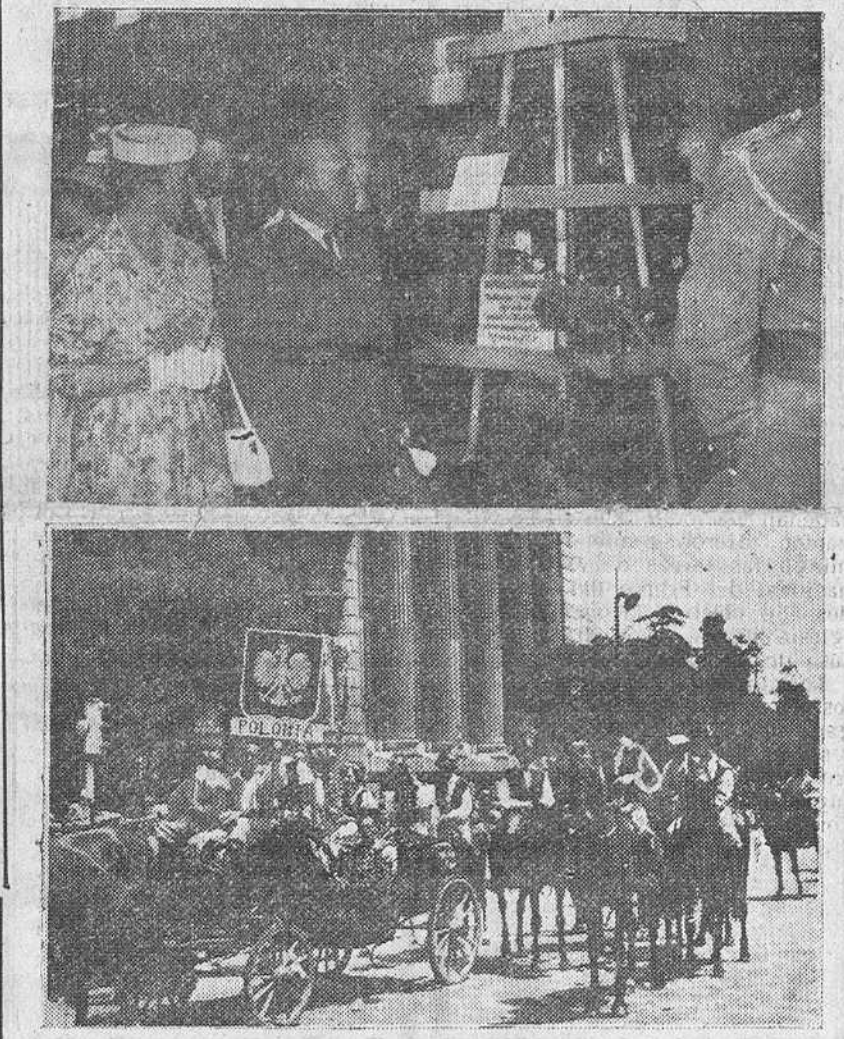
Madrid. — Dos documentos gráficos de los actos inaugurales de la Feria Internacional del Campo. En la fotografía superior, Su Excelencia el Jefe del Estado y su esposa, durante su visita al pabellón donde se expone material eléctrico. En la fotografía inferior, el grupo folklórico de la Polonia libre, que figuró en la cabalgata anunciadora del certamen.