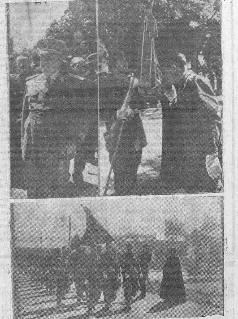
Se celebraron el domingo en nuestra ciudad y en los campamentos de Cubillo del Campo y Miranda de Ebro, solemnes actos, con motivo de la jura de la bandera de los reclutas recién incorporados a las distintas unidades de esta guarnición. En la parte superior de nuestro grabado, aparece a la izquierda, el excelentísimo señor Capitán general de la Región, teniente general Alcubilla, presidiendo el acto celebrado en el paseo de la Isla y la derecha, uno de los soldados de Caballería, besando la enseña patria. En la fotografía inferior, los reclutas del Regimiento Infantería San Marcial, desfilando bajo la bandera, en el acto celebrado en Cubillo del Campo. — (Fotos Fede).