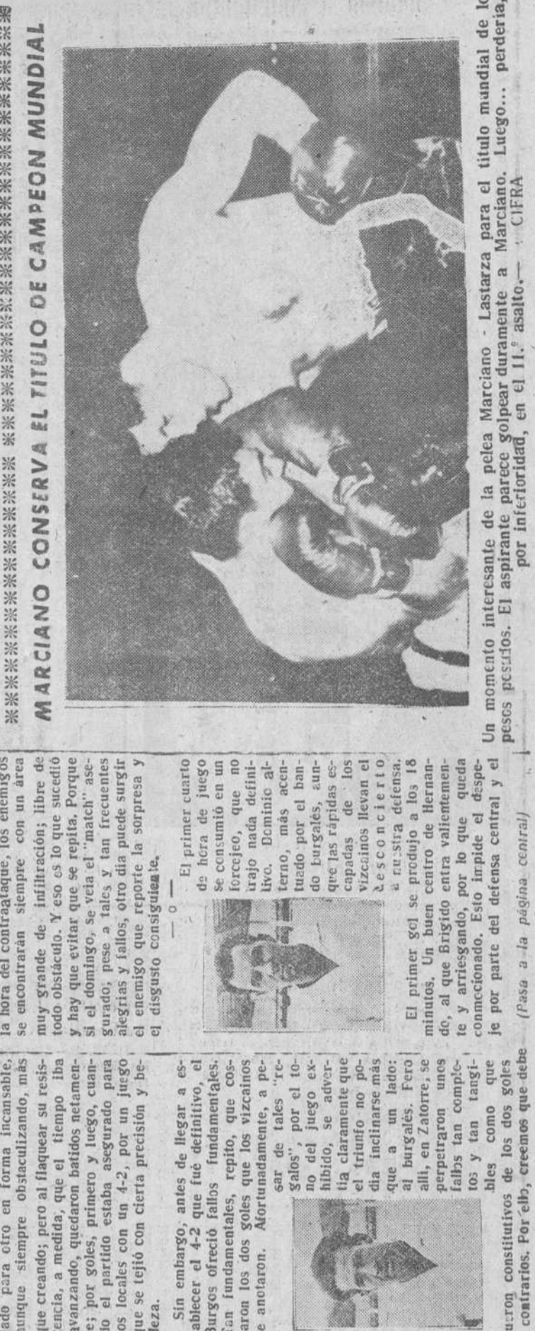
MARCIANO CONSERVA EL TITULO DE CAMPEON MUNDIAL