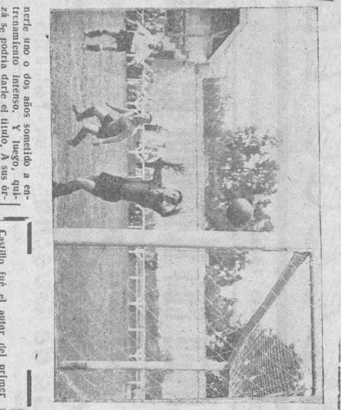
Una fotografía tomada durante el partido de Burgos y Arenas de Guécho, que terminó con el triunfo de los burgaleses.