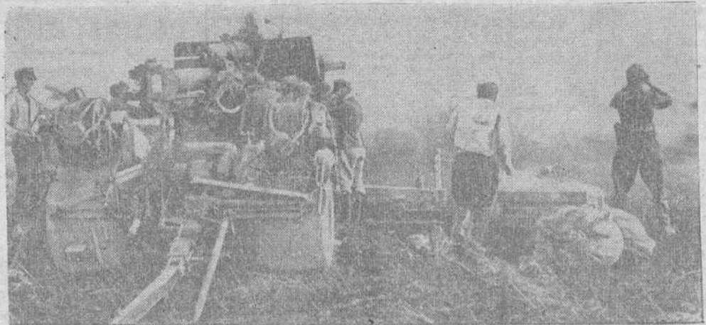
Un anti-aéreo pesado alemán, disparando en tiro directo contra los tanques rusos en el mismo Stalingrado. El poder destructor de este gigantesco cañón aniquila continuamente los tanques rusos que se aventuran al ataque