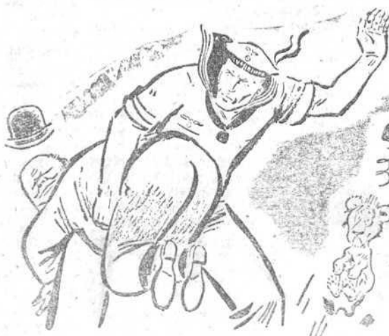
“El segundo frente de Churchill”. De “Volkischer Beobachter”, Berlín