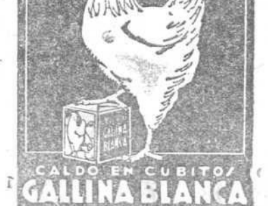
CALDO EN CUBITO GALLINA BLANCA