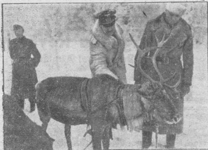
El reno es un amigo y un eficaz auxiliar de los soldados alemanes que combaten en el círculo polar. En la foto, uno de estos animales espera las órdenes de los soldados que le mandan