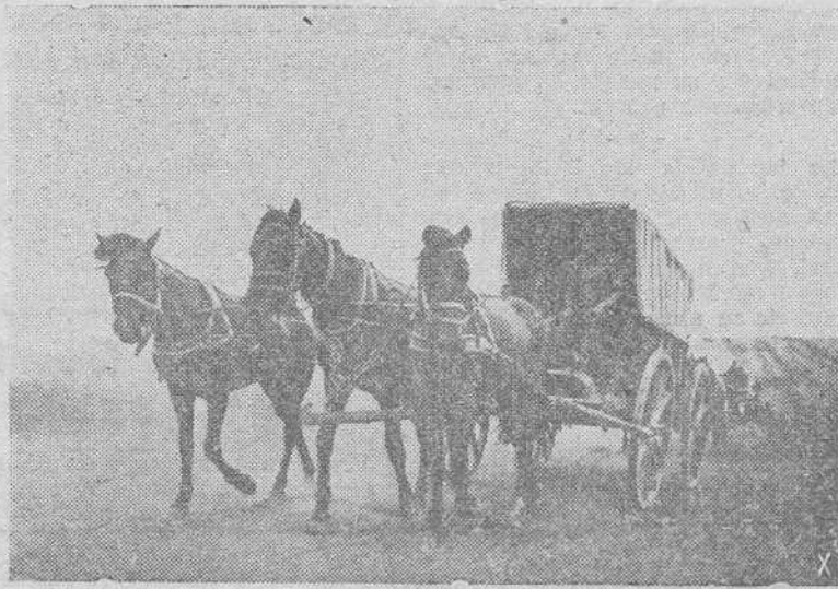
Un grupo del Servicio alemán de Trabajo sigue al Ejército alemán en su avance, empleando típicos medios de locomoción