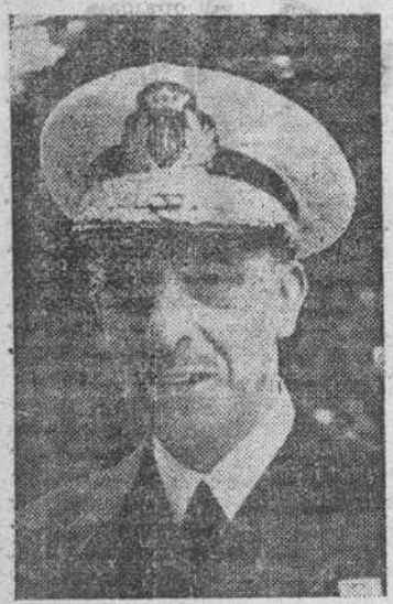
Santander.—A las once de la mañana, el ministro de Marina, don

Salvador Moreno, acompañado del subsecretario de la Presidencia, don Luis Carrero y demás personalidades de su séquito, llegó a la Biblioteca "Menéndez Pelayo", donde fué recibido por significadas personas de la Junta.