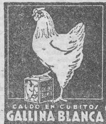
CALDO EN CUBITO GALLINA BLANCA