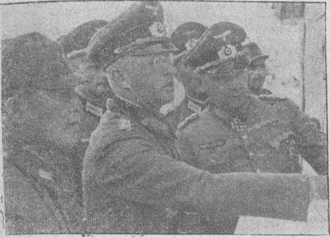
El embajador del Japón en Berlín, General Oshima, inspecciona con altos jefes del Ejército Alemán, una zona del Frente del Este