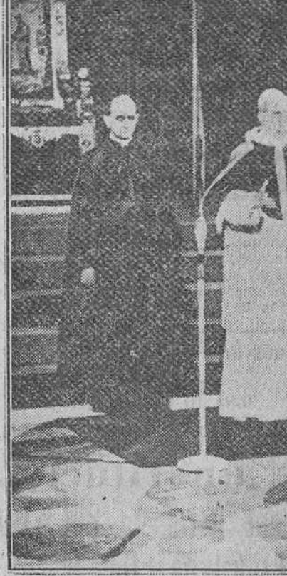
Ciudad del Vaticano.—Su Santidad el Papa, Pío XII, leyendo su mensaje al Mundo ante las cámaras de televisión, a través de las cuales ha sido escuchado por unos millones de personas, que vieron su imagen y recibieron su bendición, en la intimidad de los hogares. Es esta la primera vez en la Historia que un Sumo Pontífice posa para la televisión.