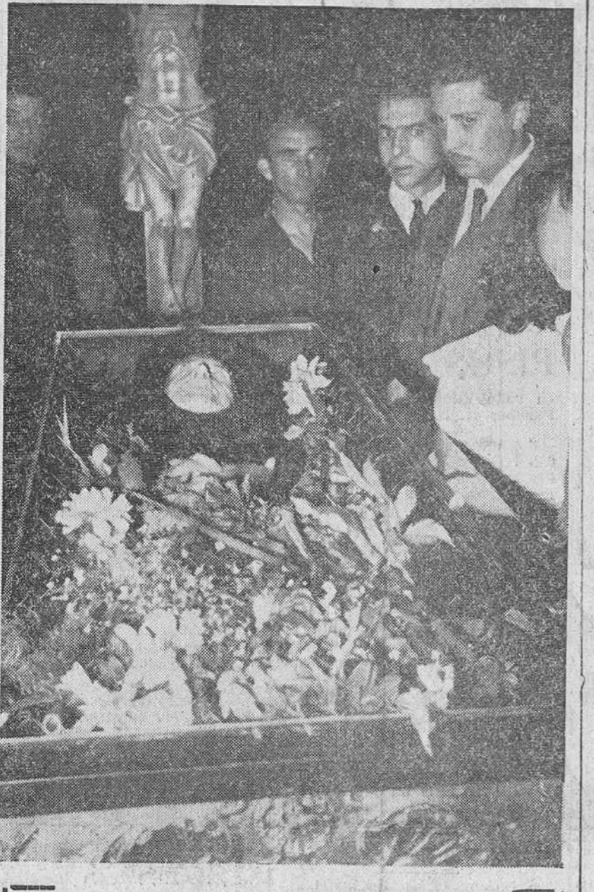
Madrid. — El cadáver de don Jacinto Benavente, nuestro Premio Nobel, amortajado con el hábito de San Francisco, en la capilla ardiente instalada en la Sociedad General de Autores de España.