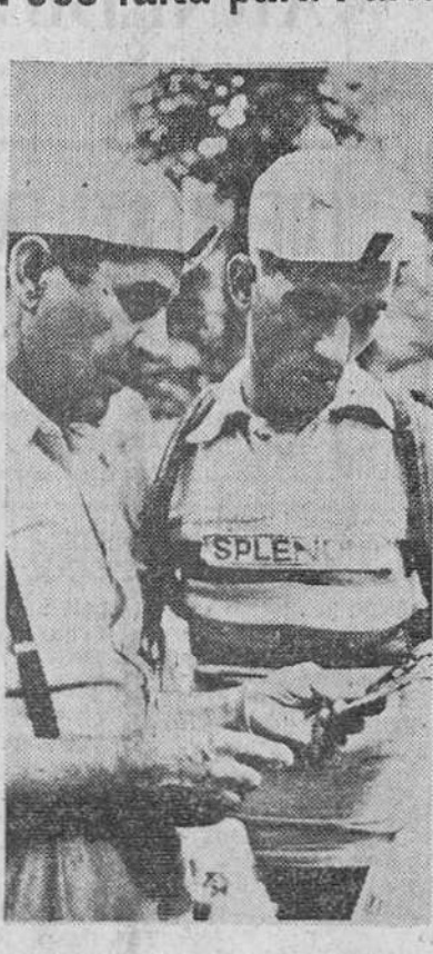
En esta reciente fotografía, cuando ya falta poco para la llegada a París, para culminar la Vuelta Ciclista a Francia...