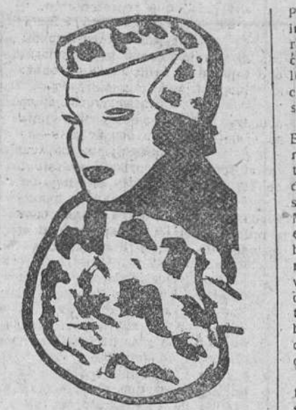
Toca de eclole y mangoito análogo. Creación Faulette. Diseño de José de Zamora.