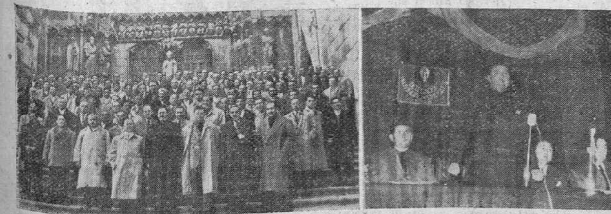
Campeños burgaleses, representantes de las distintas Hermandades de Labradores de la provincia, fotografiados a la salida de la misa del Espíritu Santo, con que dió comienzo ayer en nuestra ciudad la Asamblea provincial del campo, cuyo acto inaugural fué presidido por el gobernador civil, que aparece en la fotografía, pronunciando el discurso de apertura de las tareas del Congreso.