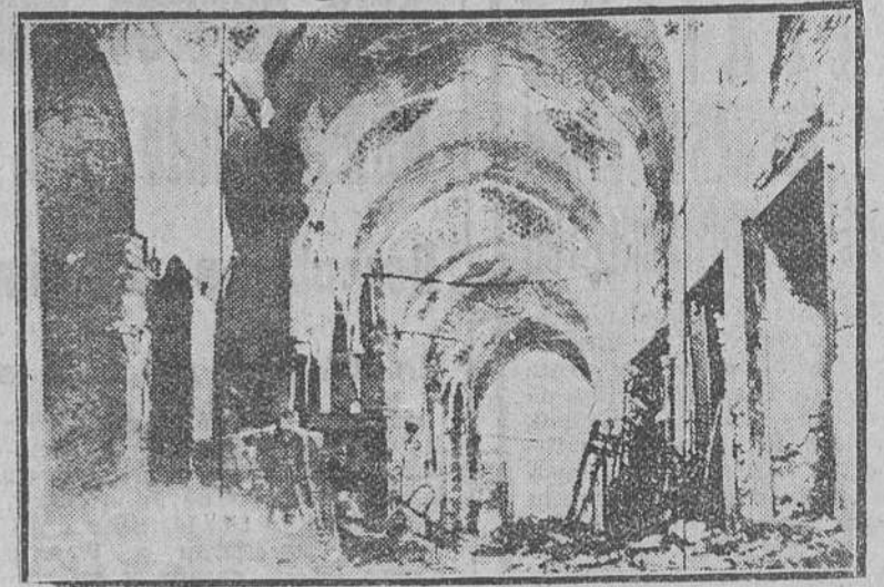
El gran bazar de Estambul ha sido devastado por un incendio, que destruyó 1.600 de los 2.000 establecimientos del inmenso mercado. Las pérdidas sobrepasan la fabulosa cantidad de diez mil millones de pesetas. He aquí una vista interior del bazar destruido por las llamas.

¡De actualidad y gran interés para los propietarios arrendadores y arrendatarios de fincas rústicas!