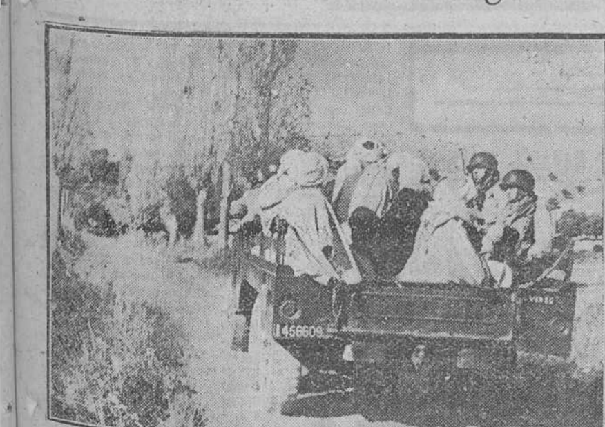
Los paraacaidistas franceses han aniquilado una banda de fellaghas entre Batna y Arris, en el macizo argelino del Aurés. Veintitrés de ellos perecieron en el encuentro y 18 fueron hechos prisioneros. Los prisioneros son llevados en camiones al Cuartel General del general Gilles, comandante de la 25 División Aerotransportada francesa.