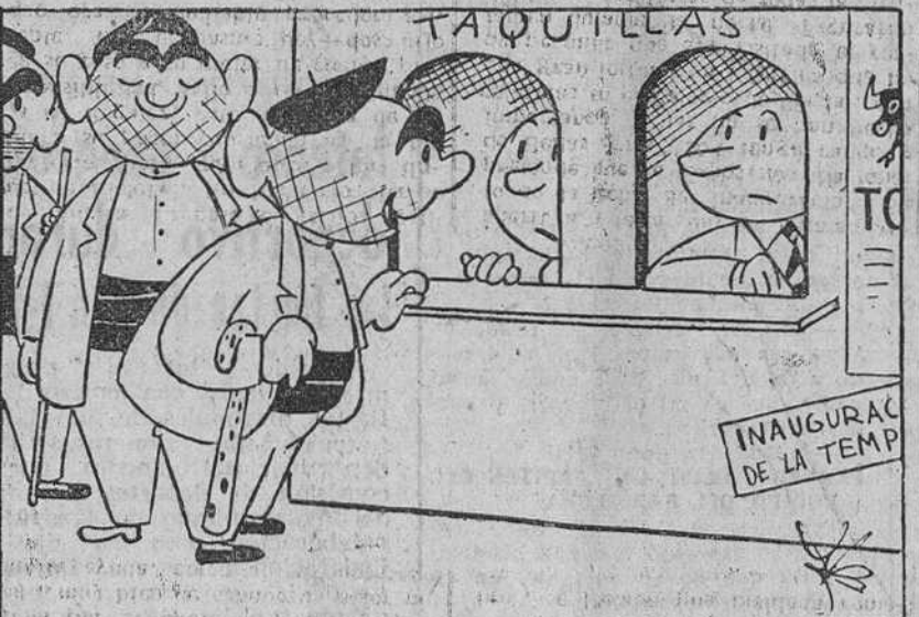
—No, nosotros no venimos por entradas; somos una comisión de la provincia que quiere estar con la empresa para expresarle nuestra gratitud.

D E Pitigrilli, el genial humorista italiano, es la ironía de doble filo que dice así: "No me deis consejos, se equivocaron ya solo." Sobre consejos moralizadores, la mejor frase que conozco es aquella según la cual, "el hombre da buenos consejos cuando no está en edad de dar malos ejemplos". Pero no voy a hablar de las exhortaciones moralizadoras —consejos venidos y para mí los quiero— sino de los consejos o recomendaciones de orden científico o profesional.