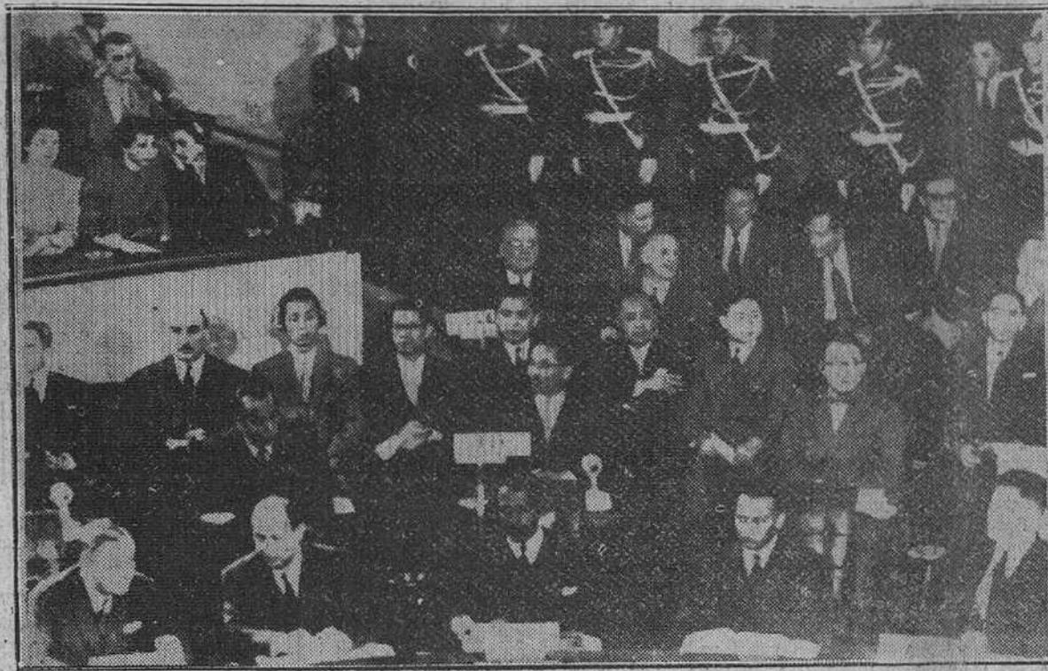
Ginebra.—Una vista parcial de la sala donde se celebra la Conferencia, durante la sesión inaugural. En primer término aparecen Mr. Bidault (a la izquierda) y el general Nam II, de Corea del Norte (a la derecha). En segundo orden, Y. T. Pyun, de Corea del Norte, y al fondo Mr. Dulles.

REORGANIZACION EN EL GOBIERNO SOVIETICO Londres.—Los recientes fracasos sufridos por la policía secreta soviética en Australia y Berlín parece que han influido en la reorganización del Gobierno soviético. El primer ministro, Malenkov, ha revelado, en efecto, que el Ministerio del Interior ha sido dividido en dos. Las direcciones generales de Seguridad del Estado han sido separadas del Ministerio en cuestión, con lo que se vuelve al viejo sistema en vigor hasta la muerte de Stalin.—Efe