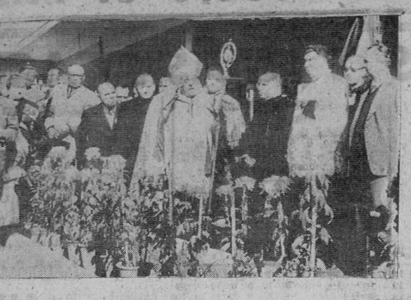
Sevilla. — El arzobispo de Sevilla, doctor Bueno Monreal en el momento de la bendición de la nueva Universidad Laboral.