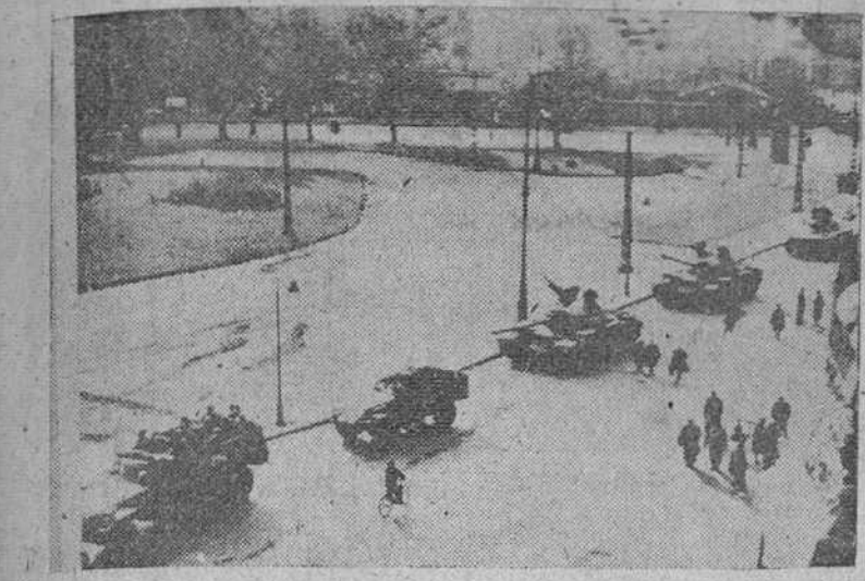
Budapest. — Una columna de tanques soviéticos atravesando la plaza del Parlamento, en una nueva ocupación de la ciudad, después de la rotura de negociaciones para abandonar las tropas rusas el territorio húngaro.

Siete divisiones, apoyadas por más de mil tanques, se apoderaron de Budapest