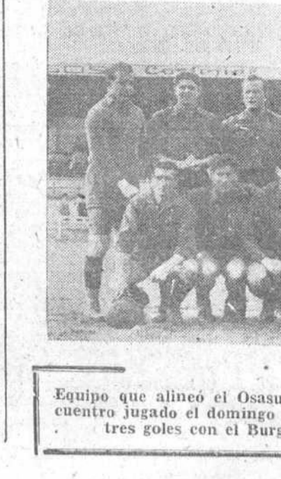
Equipo que alineó el Osasuna en el primer tiempo del encuentro jugado el domingo en Zatorre...