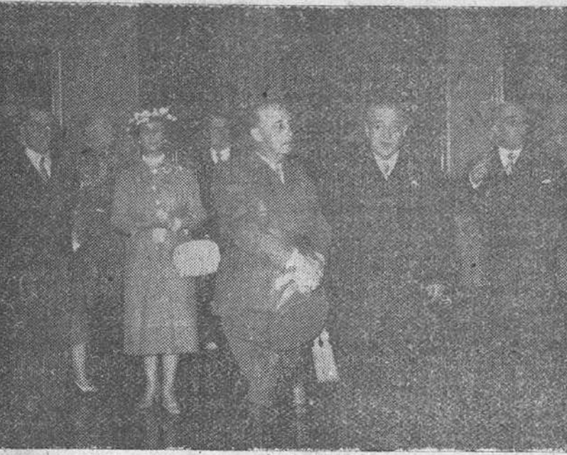
Madrid.—S. E. el Jefe del Estado y su esposa, acompañados del ministro de Educación, director del Museo del Prado y otras personalidades, durante su visita a las nuevas salas de dicha pinacoteca.