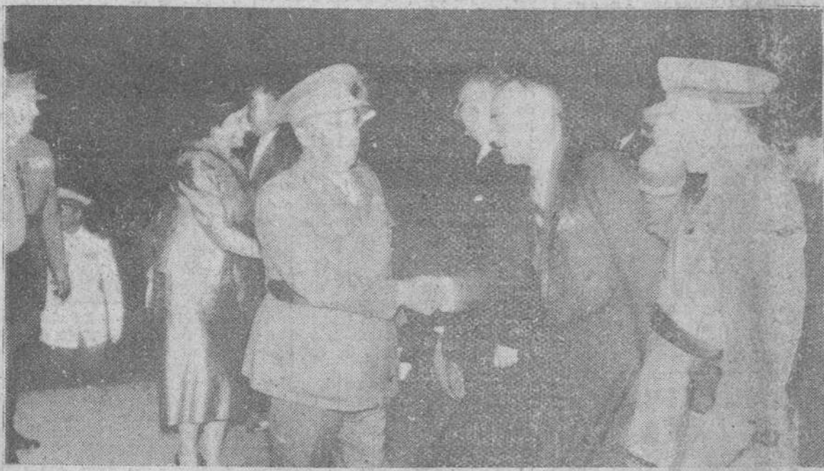
San Sebastián.— El Jefe del Estado y su esposa a su llegada al templo de Santa María para asistir a la tradicional Salve en honor de la Virgen del Coro, Patrona de San Sebastián, fueron recibidos por los miembros del Gobierno y autoridades.

El Jefe del Estado y su esposa en la Salve de la Patrona de San Sebastián