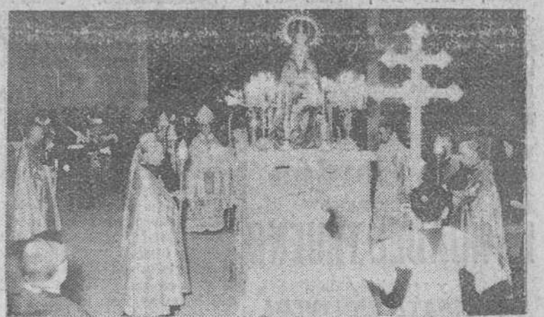
Un momento de la solemne procesion celebrada el miércoles último, en la Catedral, con motivo de la festividad de la Asunción de Nuestra Señora, patrona de nuestro Templo Metropolitano, de la ciudad y de la diócesis.