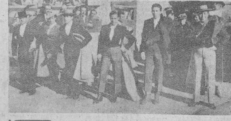
Reportaje gráfico de "Fede" sobre el festival taurino celebrado el domingo a beneficio del Asilo de Ancianos Desamparados