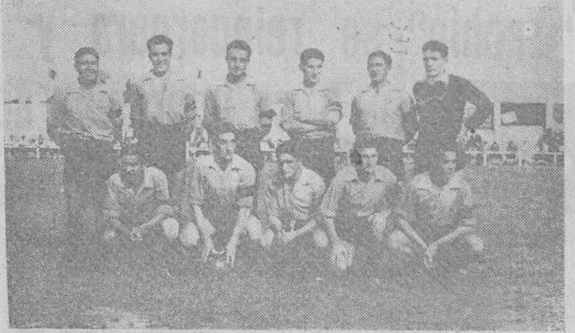
Los equipos del Burgos y el Mirandés, alineados en Anduva, el domingo último, en el primer partido de la nueva temporada.

Con el 4-2 se llegó al final de este partido en el que se hizo patente que ambos conjuntos aún precisaban de ir adquiriendo la puesta a punto para llegar a dar el rendimiento normal.