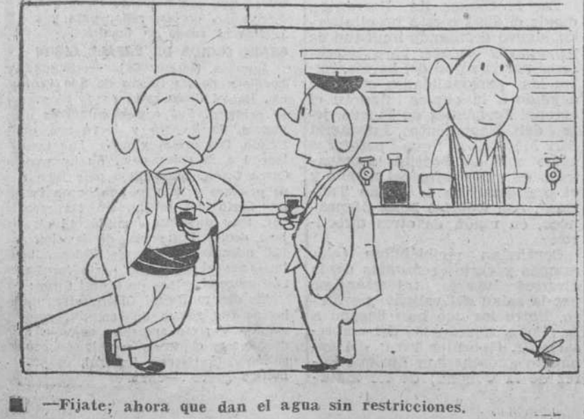
—Fíjate; ahora que dan el agua sin restricciones.