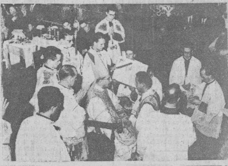
Loyola. — El Legado pontificio en las fiestas conmemorativas del 400 aniversario de la muerte de San Ignacio, Cardenal Siri, durante la solemne ceremonia de ordenación de 32 estudiantes de la Compañía de Jesús y 21 diáconos del Seminario de San Sebastián, en presencia de varios prelados, celebrada en la Basílica de Loyola.