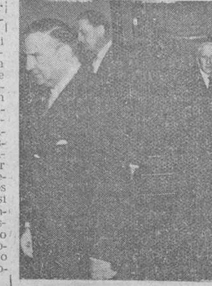
Londres. — El Sr. Martín Artajo, seguido de los demás miembros de la delegación española en la Conferencia de Londres, dirigiéndose al salón de sesiones en la Casa Lancaster.

nable" para contestar. No especificó que duración tendría "ese tiempo razonable", pero añadió que, por el momento, el Gobierno no había decidido qué medidas tomaría Francia si la respuesta de Nasser fuera negativa. "El Gobierno —terminó— mantiene su actitud de firmeza."