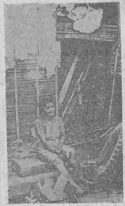
Esta mujer de Cali llora la pérdida de toda su familia que pereció en la explosión. Su rancho quedó completamente destruido.

Nicosia. — Los chipriotas griegos consideran las ofertas de rendición a los nacionalistas de la "Eoka" como inaceptables para los miembros de la organización extremista.