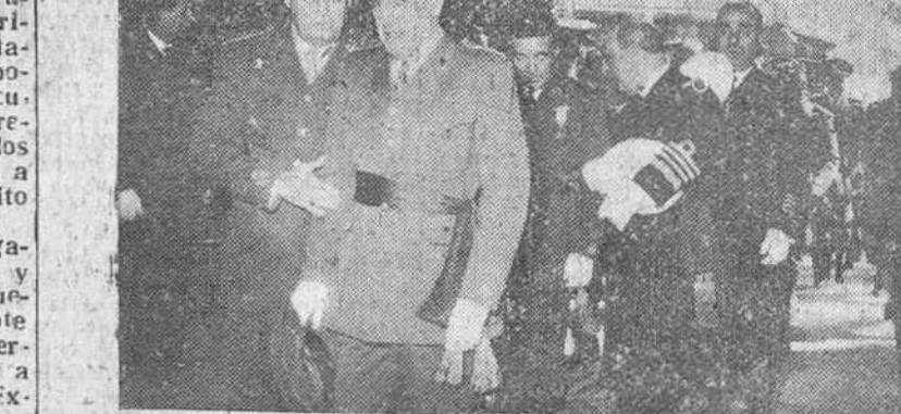
Madrid. — El ministro de Ejército, en representación de Su Excelencia el Jefe del Estado, acompañado del director de la Escuela Superior del Ejército, y los ministros de Marina, Aire, Gobernación y de la Presidencia, a la entrada al templo de San Francisco el Grande, para asistir al solemne pontifical oficiado por el vicario general castrense, Dr. Alonso Muñozyerro, como homenaje al Santo Padre.