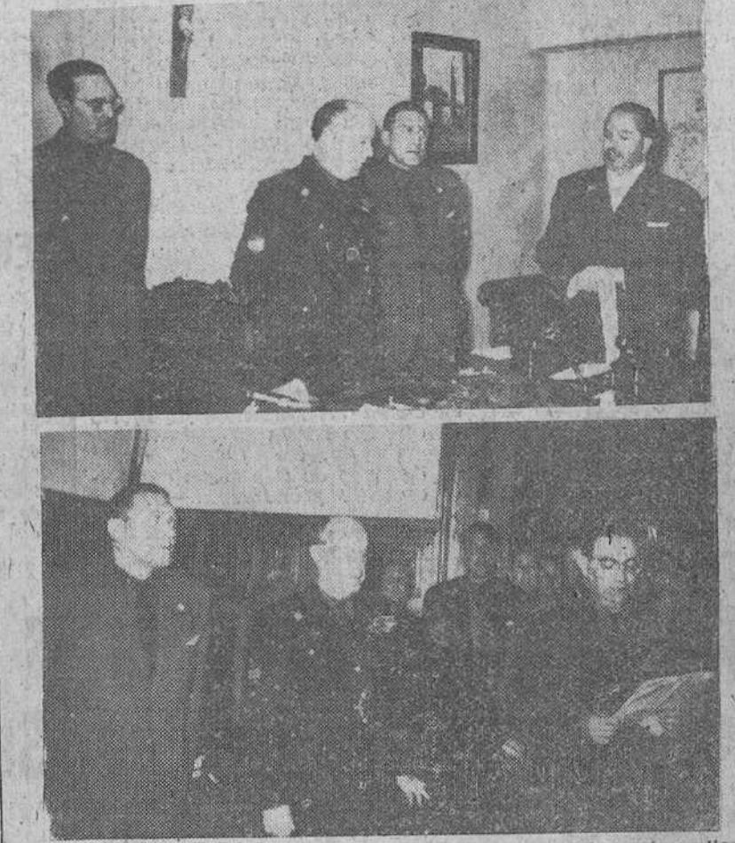
En la noche del domingo llegó a nuestra ciudad el nuevo gobernador civil, don Servando Fernández-Victoria y Camps que, en la mañana de ayer efectuó visitas de cortesía al Prelado de la diócesis, capitán general accidental de la región y demás primeras autoridades de la capital, así como al alcalde de la ciudad y al presidente de la Diputación. En el Ayuntamiento fue recibido bajo mazas y penetró en el edificio mientras timbaleros y clarinetos le rendían honores interpretando la "Marcha de la Ciudad". Por su parte, en la Diputación, cuya comisión de Gobierno estaba celebrando sesión cuando llegó el señor Fernández-Victoria, este fue invitado por el presidente de la Corporación a que la honrase presidiendo su sesión, cosa que hizo durante breves momentos, que aprovechó para saludar cordialmente, en la Diputación, a toda la provincia.

Burgos - dijo el nuevo gobernador civil a la Prensa - ma ha producido una magnífica impresión