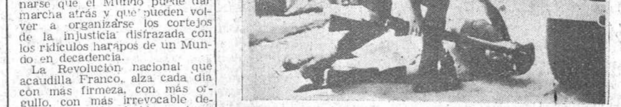
Nicosia (Chipre). — Un soldado del Regimiento de Stanfordshire es auxiliado por un compañero, segundos después de caer gravemente herido, a consecuencia de la explosión de una bomba que fue arrojada sobre una patrulla inglesa cerca de la catedral griega ortodoxa. En segundo término, un griego herido espera sentado a la entrada de una casa para ser atendido. Estos incidentes ocurrieron cuando las tropas trataban de dispersar una manifestación de muphachos escolares.