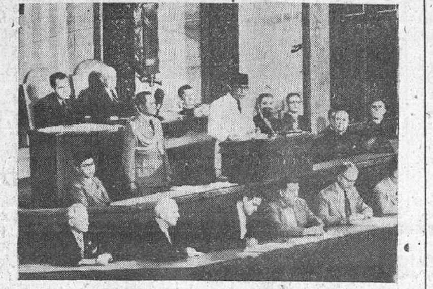
Washington. — El presidente Sukarno, de Indonesia, durante su discurso en el Congreso de los Estados Unidos, con motivo de su estancia en Norteamérica. Dicha sesión fue presidida por el vicepresidente Nixon.