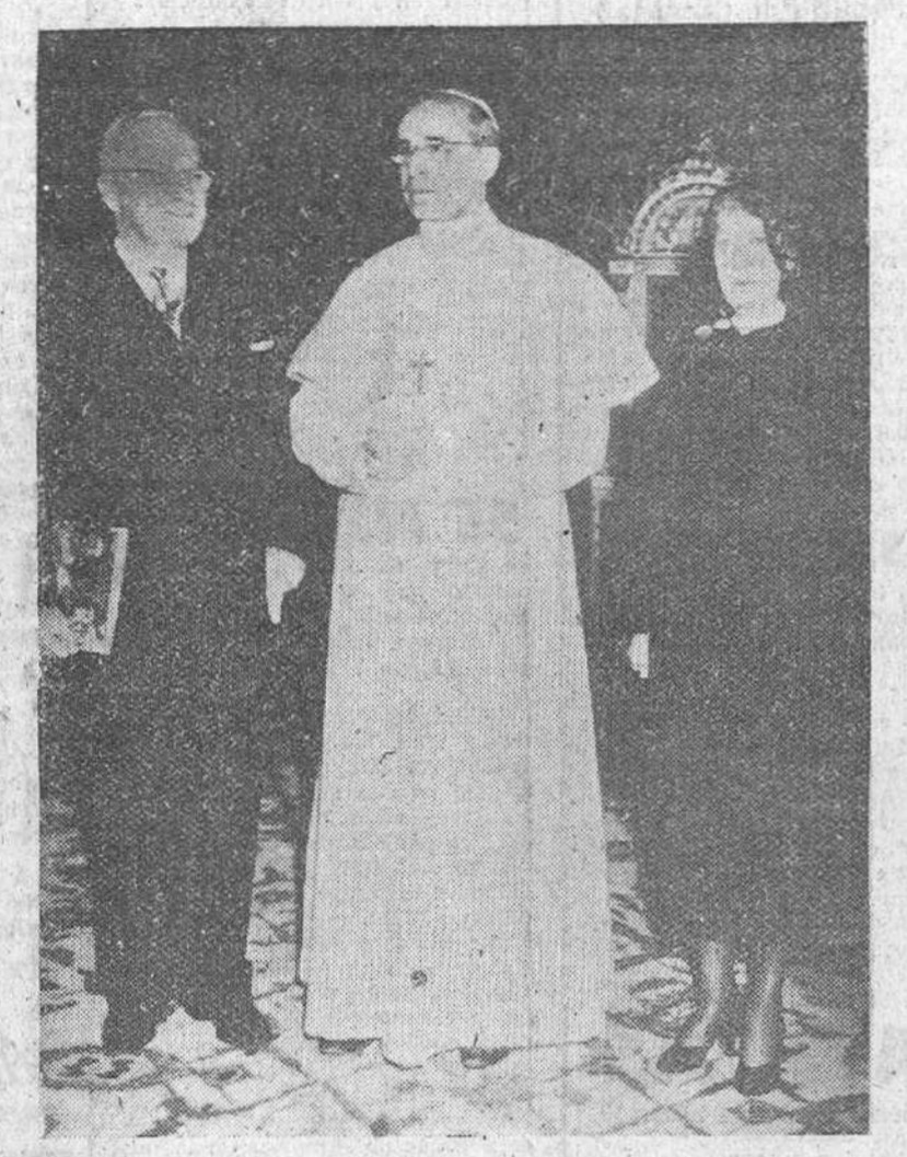
Ciudad del Vaticano. — S. S. Pio XII con el ex-presidente de los Estados Unidos, Mr. Truman, acompañado de su esposa, durante la audiencia que les concedió.

Audiencia privada del Santo Padre al ex-presidente Truman