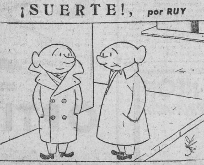
— Esperemos que al Burgos no le toque "la pedrea" en Gijón.