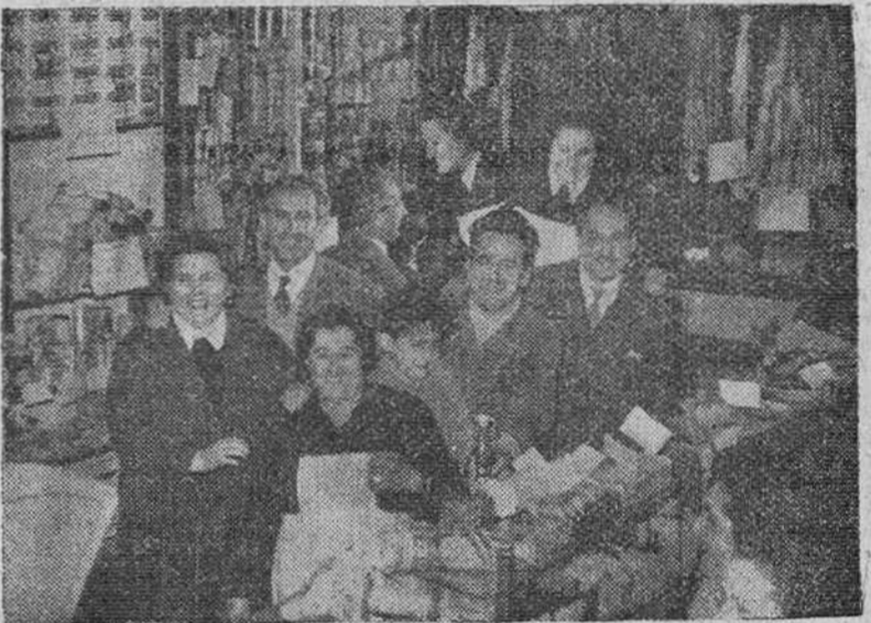
Los propietarios y empleados de la "Lonja Conservera" de Burgos muestran su contento por haberles correspondido 225.000 pesetas en una participación del "gordo".

No, mi tierra burgalesa no es árida; en ella arraiga maravillosamente la flor de la caridad.