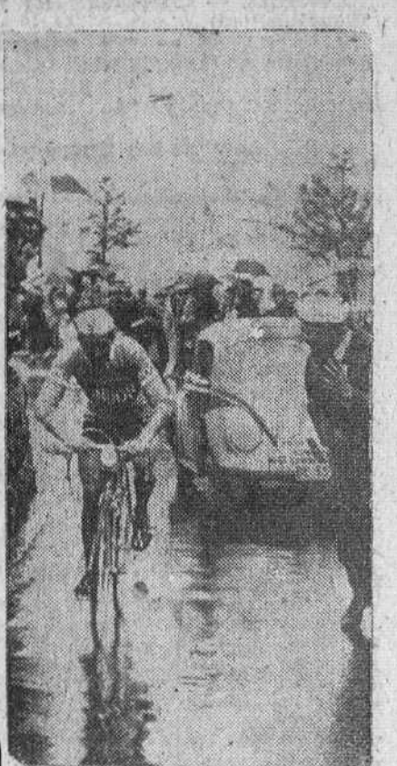
Zurich.— El español Bahamontes subiendo el Wildhaus, de 1.090 metros de altitud, durante su participación en la Vuelta Ciclista a Suiza, en la que ha ganado ya dos etapas.