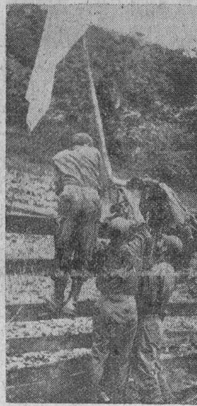
Fruta de Pan (Nicaragua).— Soldados de un grupo de 46 pertenecientes a las fuerzas rebeldes que invadieron Nicaragua el 31 de Mayo pasado izan la bandera blanca en señal de su rendición incondicional al Gobierno.