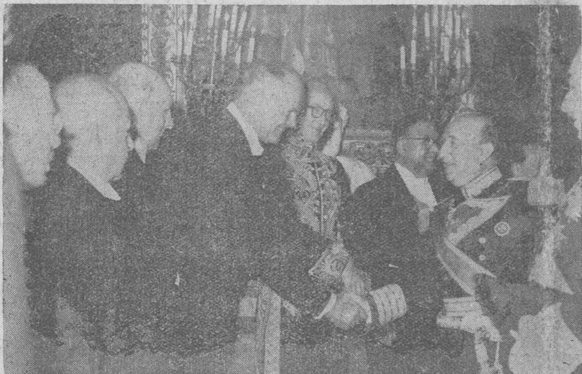
Madrid.—S. E. el Jefe del Estado saluda al embajador norteamericano, señor Lodge, durante la recepción celebrada en el Palacio de Oriente, con motivo del XXIII aniversario de la exaltación del Generalísimo Franco a la Jefatura del Estado.