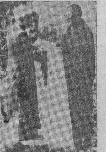
Mussoorie (India). - Por primera vez desde que el Dalai Lama llegó a la India, procedente del Tibet, huyendo de la persecución comunista, se ha entrevistado con el primer ministro indio, Mr. Nehru, a quien vemos en la foto ofreciendo al Dalai Lama el tradicional chái de la amistad a la llegada a la residencia de éste, en Mussoorie.