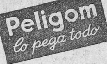
Peligom Lo pega todo