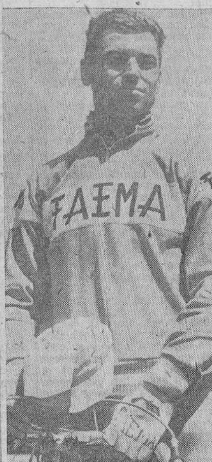
Rik Van Looy, "la centella belga", considerado como el corredor más completo de cuantos participan en la Vuelta y que ayer, por tercera vez, se erigió en vencedor de la etapa en Barcelona.