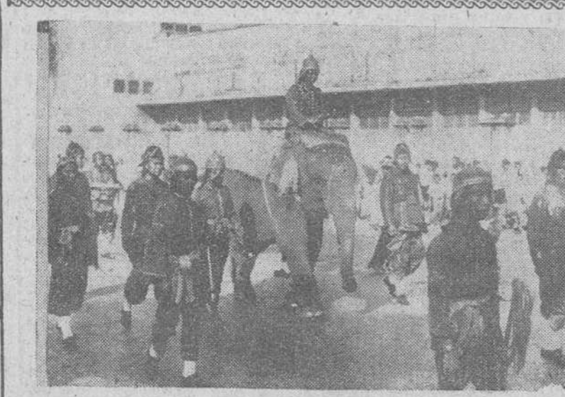
El presidente Eisenhower en el aeropuerto de Ciampino.

Roma. — El presidente Eisenhower ha llegado a la Ciudad Eterna en la primera etapa de su histórico viaje que le llevará a visitar once naciones de Europa, Asia y África. Una persistente lluvia y una niebla ligera produjo un breve retraso en el aterrizaje del brillante "Boeing 707", que aterrizó en el aeropuerto de Ciampino a las 12.13 exactamente, al final de las diez horas de vuelo que ha invertido desde Washington. Los jueces de la pista, que habitualmente son encendidas de noche, han tenido que ser utilizadas para el aterrizaje del gigantesco cuatrirreactor, debido a la niebla. El avión del presidente norteamericano voló sobre Roma y continuó descendiendo con dirección al aeropuerto de Ciampino. El piloto del avión presidencial pidió a la torre de control que le informasen acerca de las condiciones meteorológicas en Nápoles, a 250 kilómetros de Roma. Sin embargo, al tiempo que la lluvia arreciaba sobre el aeropuerto romano, mejoró la visibilidad ligeramente y se decidió el aterrizaje en el aeropuerto de Ciampino, en el que inmediatamente se encendieron las luces para facilitar la toma de tierra. Eisenhower ha sido recibido en el aeropuerto romano por el presidente de la República italiana, Giovanni Gronchi; jefe del Gobierno, Antonio Segni; ministros de Defensa y de Asuntos Exteriores; presidente del Parlamento; Nuncio Apostólico en Italia; embajador norteamericano y otras personalidades.