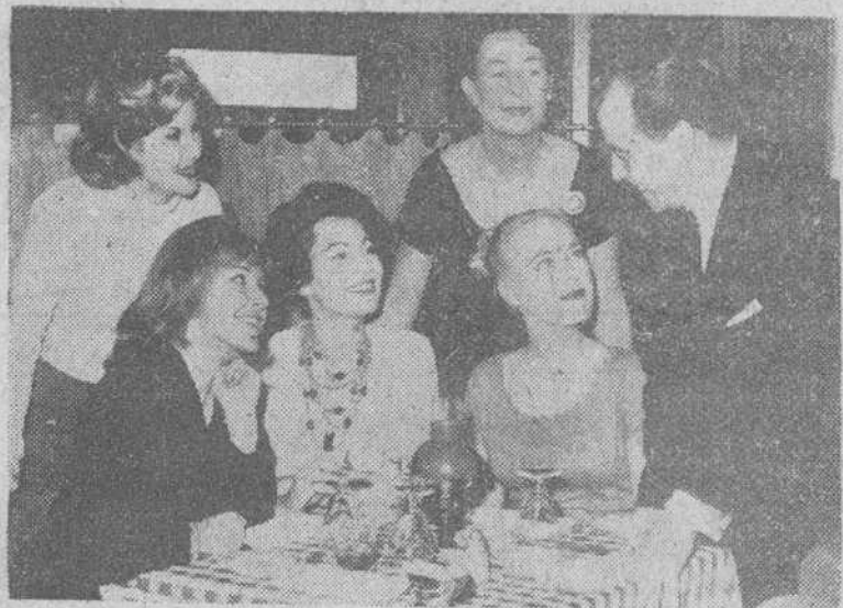
Ramón Navarro vendrá a Madrid para rodar una película

donde a las dos menos cuarto de la tarde recibieron cristiana sepultura, en el panteón familiar, los restos mortales del fallecido Capitán general de Burgos.