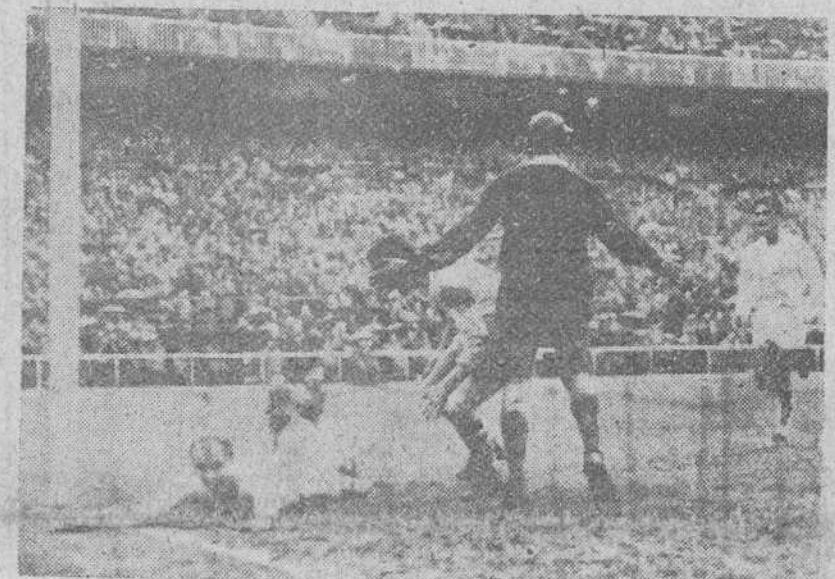
Victoria del Madrid sobre el Barcelona

El ministro español recorrió la ciudad, conferenció con las autoridades en el Ayuntamiento y visitó el campo de refugiados de Marienfelde. También recorrió, durante cuarenta minutos, el sector soviético de Berlín. Después de su visita declaró que estaba anonadado por la diferencia existente entre el alegre y animado sector occidental y el triste y gris oriental. — Efe.