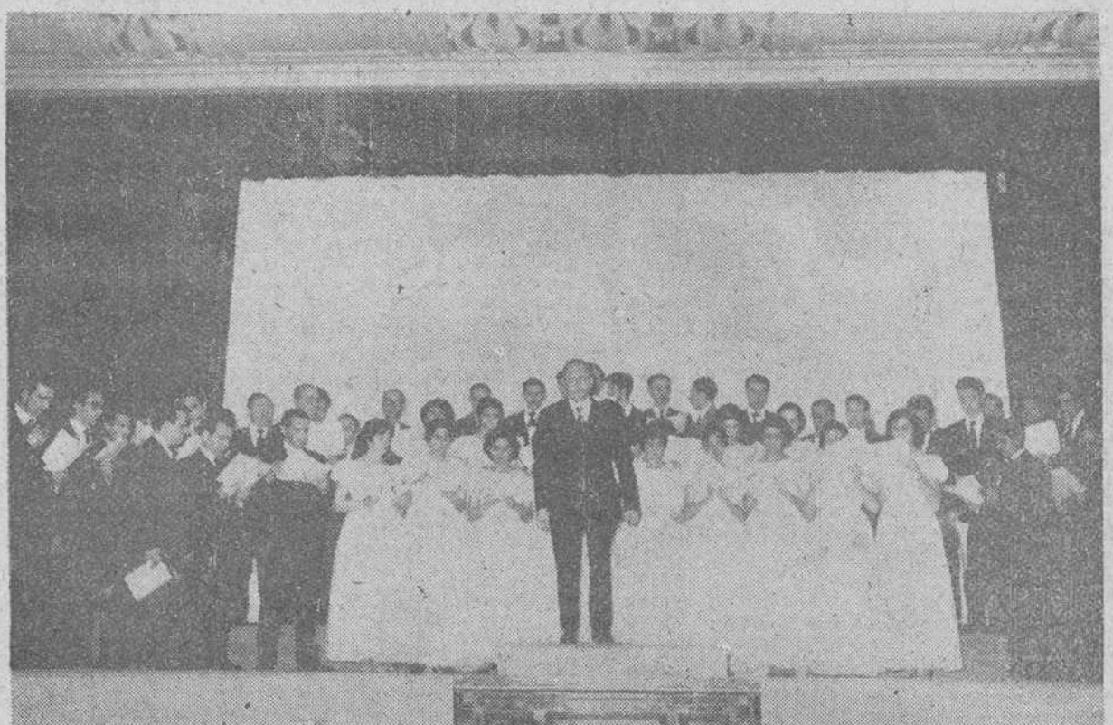
Los componentes de la Schola Cantorum, con su director al frente, recibiendo el aplauso del público, al concluir la interpretación de una de las obras.