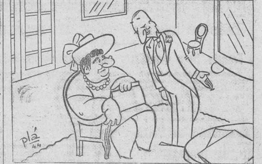
La señora.—Y para la cara ¿qué me recomienda? El encargado despistado.—Una goma de borrar, señora.