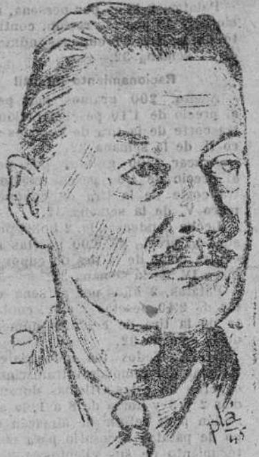
SIR HAROLD LEOFRIC GEORGE ALEXANDER

Londres.—El Rey Jorge VI ha designado para suceder a Lord Athlone como gobernador general del Canadá, al mariscal Alexander, hasta ahora comandante jefe aliado del Mediterráneo.