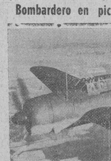
El nuevo bombardero en picado del Ejército norteamericano, A-25 durante un vuelo de prueba. Es un monoplano de ala media, provisto de un motor de 1.700 c. v. Estos aparatos fueron usados con notable éxito durante las últimas operaciones de la guerra en el Pacífico