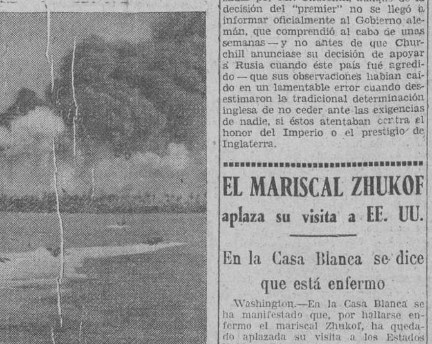
Tropas de la séptima división de Infantería australiana, dirigiéndose a una cabeza de desembarco establecida al Este del gran centro petrolífero de Balikpapan de Balikpapan