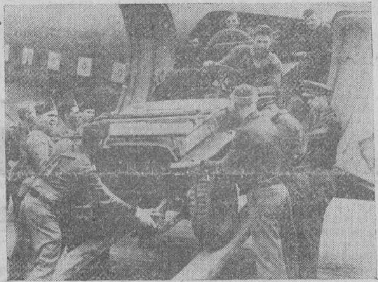
Soldados norteamericanos descargando un coche "Jeep" de un avión de transporte