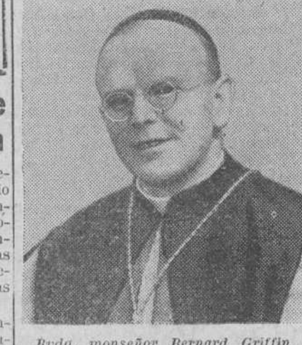
Rvdo. monseñor Bernard Griffin, Arzobispo de Westminster

El régimen de Franco, lejos de debilitarse, se robustece—dice el «The New York Times»