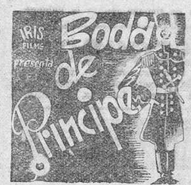
Marta HARELL y Willy FRITSCH

HOY — ULTIMO DIA DE GRAN EXITO VIVIRE OTRA VEZ por Alicia de PHILIPS y David SILVA MAÑANA Jueves de Moda SENSACIONAL ESTRENO