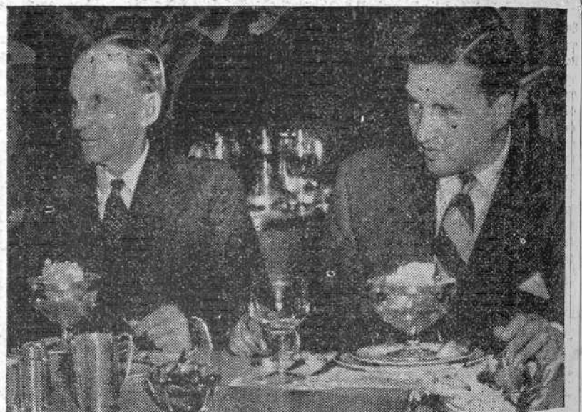
Henry Ford y su nieto, Henry Ford II, retratados recientemente en Dearborn (Michigan) con motivo de la Asamblea celebrada por los altos jefes de la Industria Americana del Automóvil. En ella, el joven Ford al exponer sus planes de post-guerra, afirmó que la producción automovilística americana llegaría, en pocos años, a alcanzar la cifra récord de siete millones de unidades anuales.