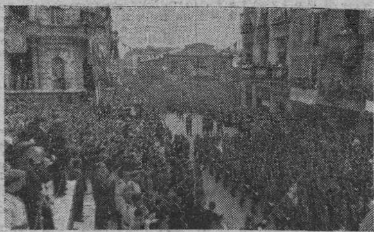
Desfile de la guarnición de Vitoria ante la presencia de S. E. el Jefe del Estado, durante la celebración de los actos en memoria de Fray Francisco de Vitoria.