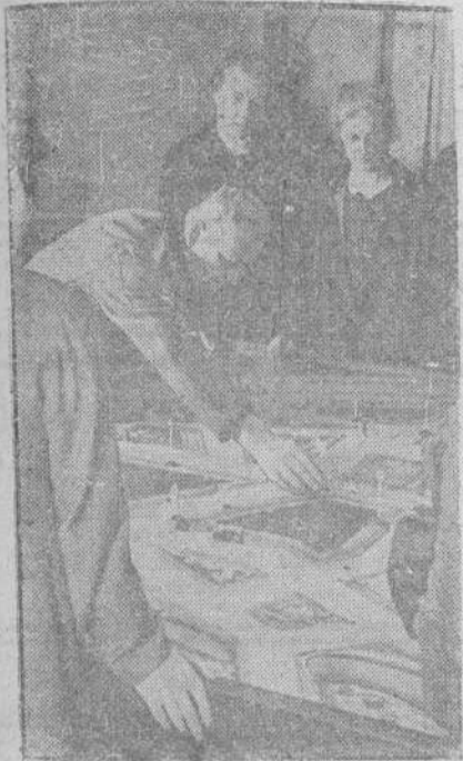
En Alemania se instruye a las mujeres en el manejo de los automóviles para suplir en el trabajo a los hombres. La foto nos muestra una lección sobre una maqueta.

Gran Cuartel general del Führer.—El Alto Mando de las fuerzas armadas comunica.