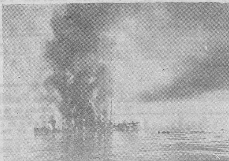
Un petroero aliado, alcanzado por un torpedo de un submarino alemán, arde en el Atlántico