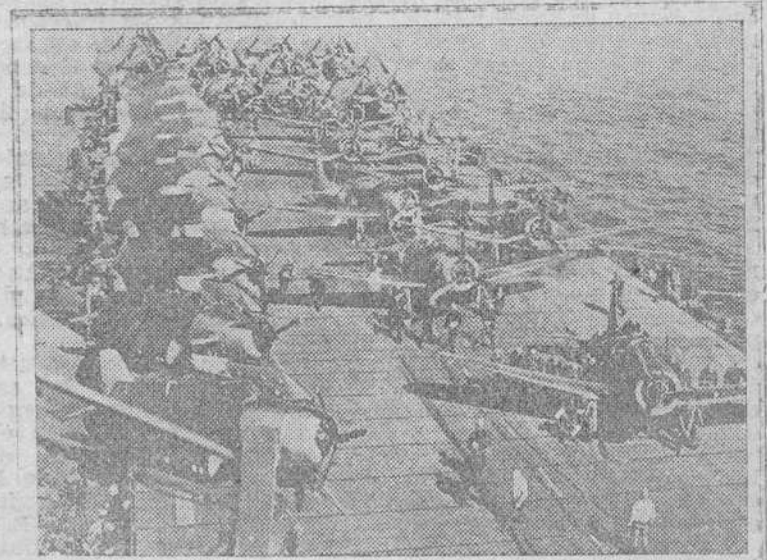
La cubierta de vuelo de este nuevo portaaviones americano, que fué antes un crucero ligero, atestado de cazas Wildcat, bombarderos Dauntless y torpederos Avenger