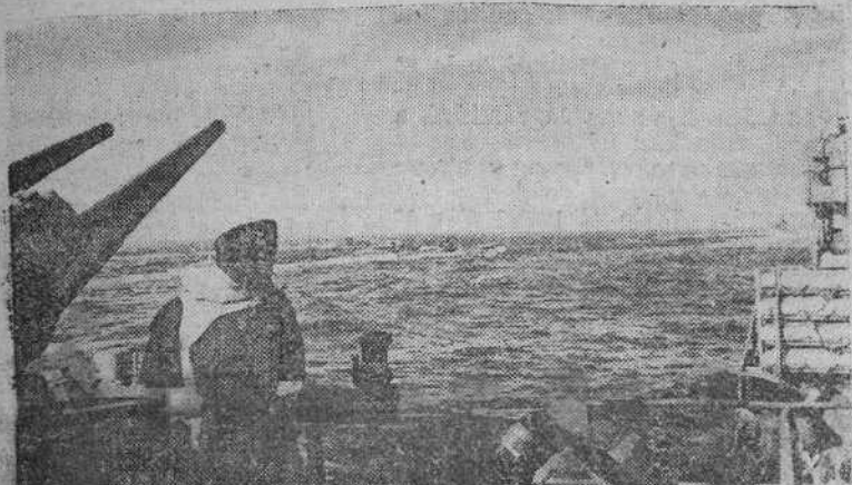
Los destructores alemanes ejercen su labor protectora sobre los submarinos en el Mar del Norte