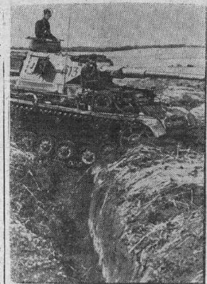
Hasta las mismas trincheras rusas llegó este domingo alemán en los últimos combates librados en Rusia