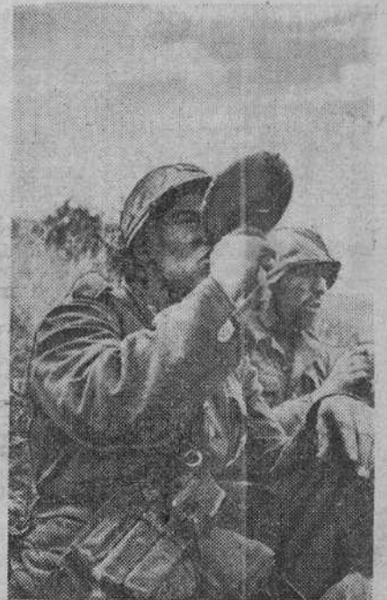
Un buen trago de la cantimplora en un breve descanso de las fuertes luchas defensivas en el frente ruso