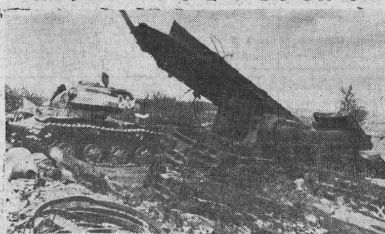
Tanques rusos, abandonados en ingente montón, cubren buena parte del terreno que días antes fué atacado por la Luftwaffe