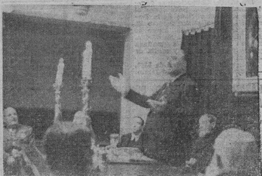
En la Real Academia de Jurisprudencia, el ministro de Justicia, señor Aunós, dió posesión de sus cargos a los miembros del Consejo Superior de Protección de menores, recientemente nombrados.