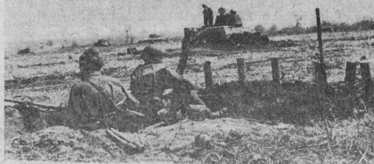
Dos soldados alemanes, centinelas en una posición avanzada del frente Este, observan las posiciones soviéticas