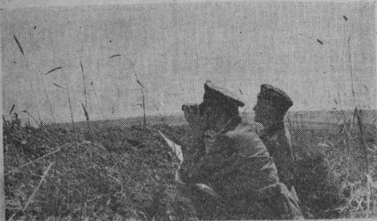
Desde las trincheras, un alto jefe alemán observa los movimientos de las tropas soviéticas